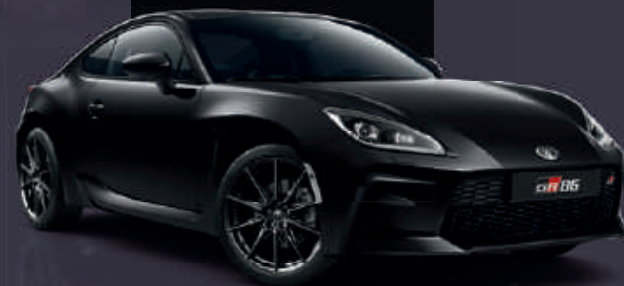
Crystal Black (D4S)*