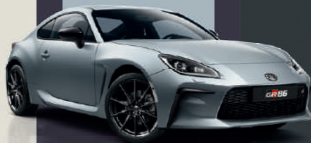
Ice Silver (G1U) §