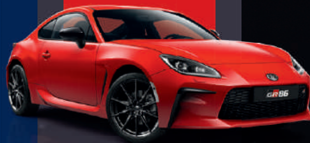
Ignition Red (DCK)*