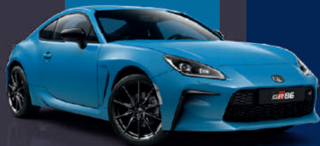
Nitro Blue (DAR)