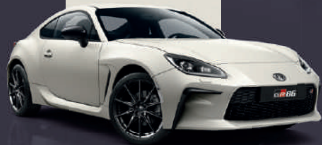
Crystal White (K1X)*